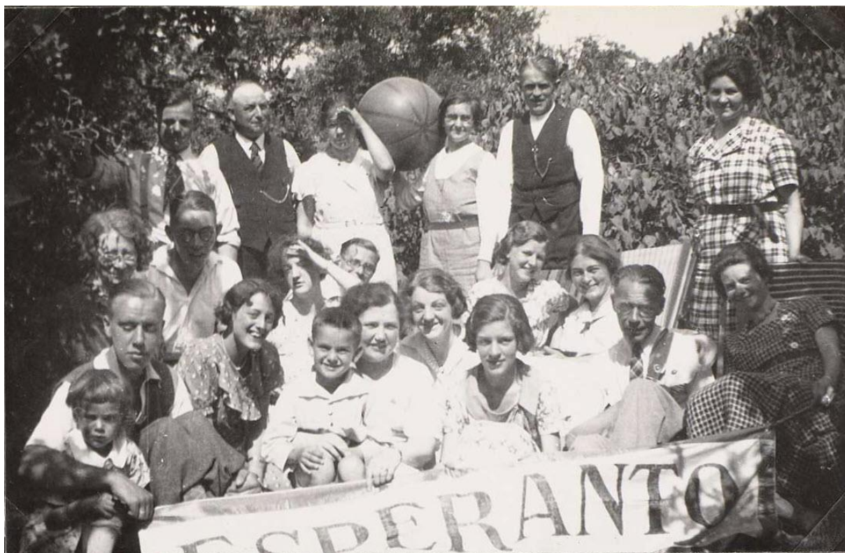
Groepsportret tijdens een Esperanto-bijeenkomst op 4 augustus 1935, op de voorgrond een banier met 'Esperanto'.